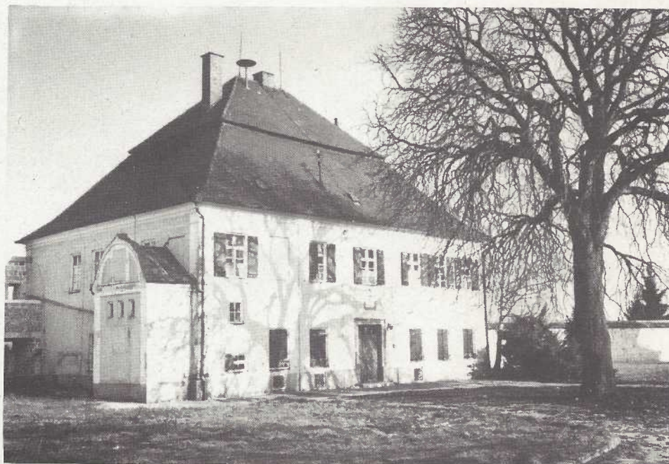
Altes Krankenhaus - Neues Rathaus? Was kostet das?

Marktniveau zu verschleudern, aber ganz bestimmt auch nicht als Preistreiber zu fungieren. Warum wird bei uns kein Einheimischenmodell aufgestellt, wie wir immer wieder vorschlugen und welches eindeutig preisdämpfend auf den heimischen Immobilienmarkt einwirken würde? Wir sind uns selbstverständlich bewußt, daß mit einem Einheimischenmodell nicht generell gegen den Zeitgeist, also den Marktpreis, geschwommen werden kann, aber den kleinen Verhandlungsspielraum der zur Verfügung