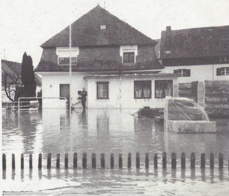
Scheitert die Hochwasserfreilegung am Geld?

„Zu Ihren grundsätzlichen Anmerkungen, daß das Wasserwirtschaftsamt nicht ausreichend tätig geworden sei, übermitteln wir Ihnen Ablichtung der schriftlichen Anfrage des Herrn Abgeordneten Rudolf Engelhard vom 22.05.1990 und deren Beantwortung durch die Staatsregierung vom 24.07.1990. Sie mögen daraus erse-